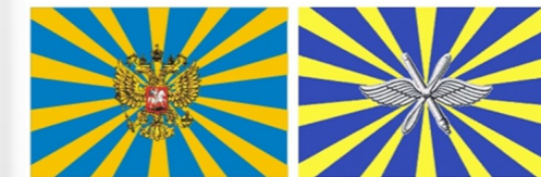
Знамя и флаг ВВС РФ