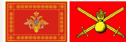
Знамя и флаг сухопутных войск РФ